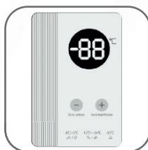
Termostato exterior digital