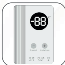
Termostato exterior digital