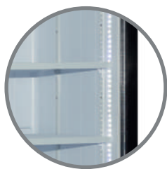
Repisas regulables Iluminación interior LED