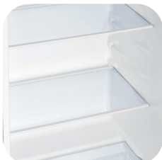
2 bandejas de vidrio templado y borde antiderrame