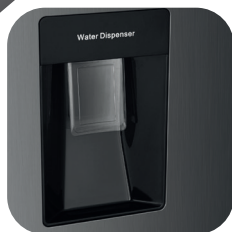
Dispensador de agua 2 lts.