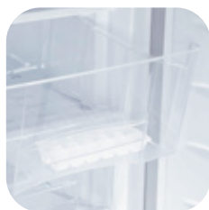
6 cajones termoplásticos