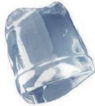
Cubo de hielo, 36 gr.