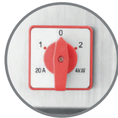
Indicador de velocidad