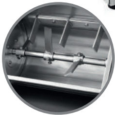
Aspas en acero inoxidable