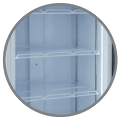
Repisas regulables Iluminación interior LED