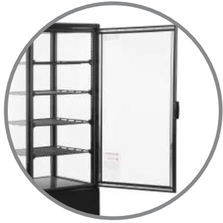
Puerta frontal recta de vidrio

Equipo ideal para mantención y exhibición de productos