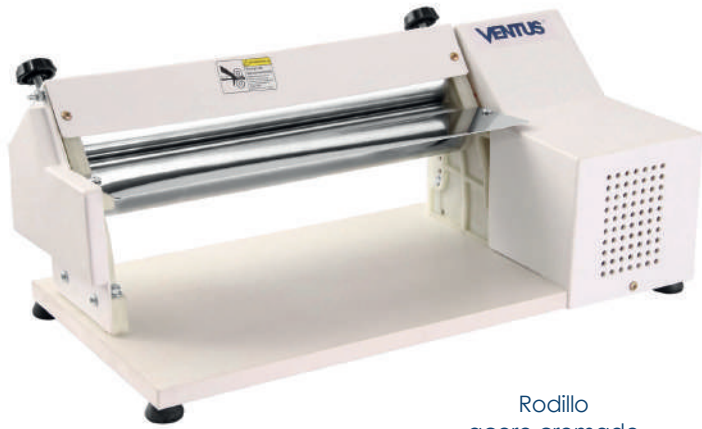
Rodillo acero cromado