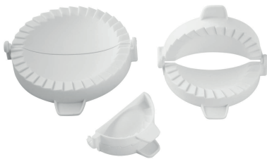
Moldes para empanadas