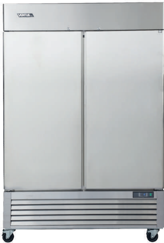
Controlador Digital Carel

Equipo ideal para comercio y cadenas Food Service