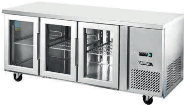
Controlador Digital Carel

Equipo ideal para preparación y refrigeración de productos