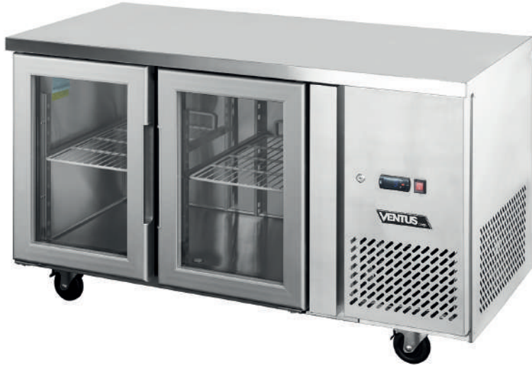
Controlador Digital Carel

Equipo ideal para preparación y refrigeración de productos