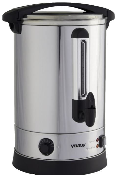
Fotografía de referencia.